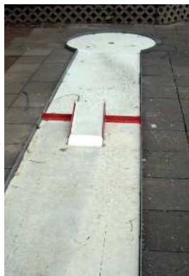
Schanze in Köln

Der Kölner MC hat seine Bahn 16, die liegende Schleife abgebaut. Als neues Hindernis gibt es dort eine Schanze.