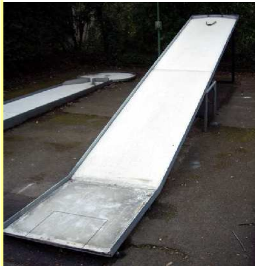
V in Wesseling

Der MGC Düren hat die Bahn 5, liegende Schleife, abgebaut und als neues Hindernis eine Töter.