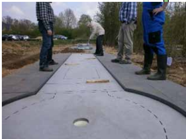
Eine erste Bahn wird „eingespielt“.

Danach heißt es allerdings noch einmal „die Ärmel hochkrempeln“ um bis zu unserem IMT am letzten