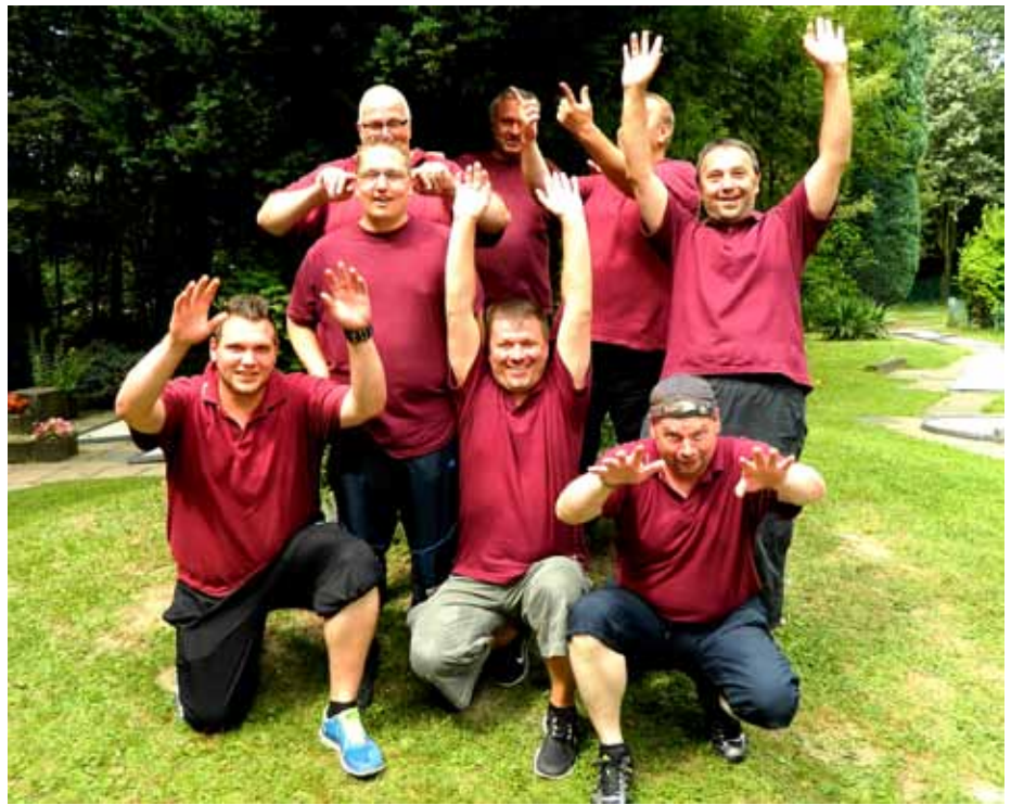
Die siegreiche Mannschaften aus Büttgen mit Betreuer.