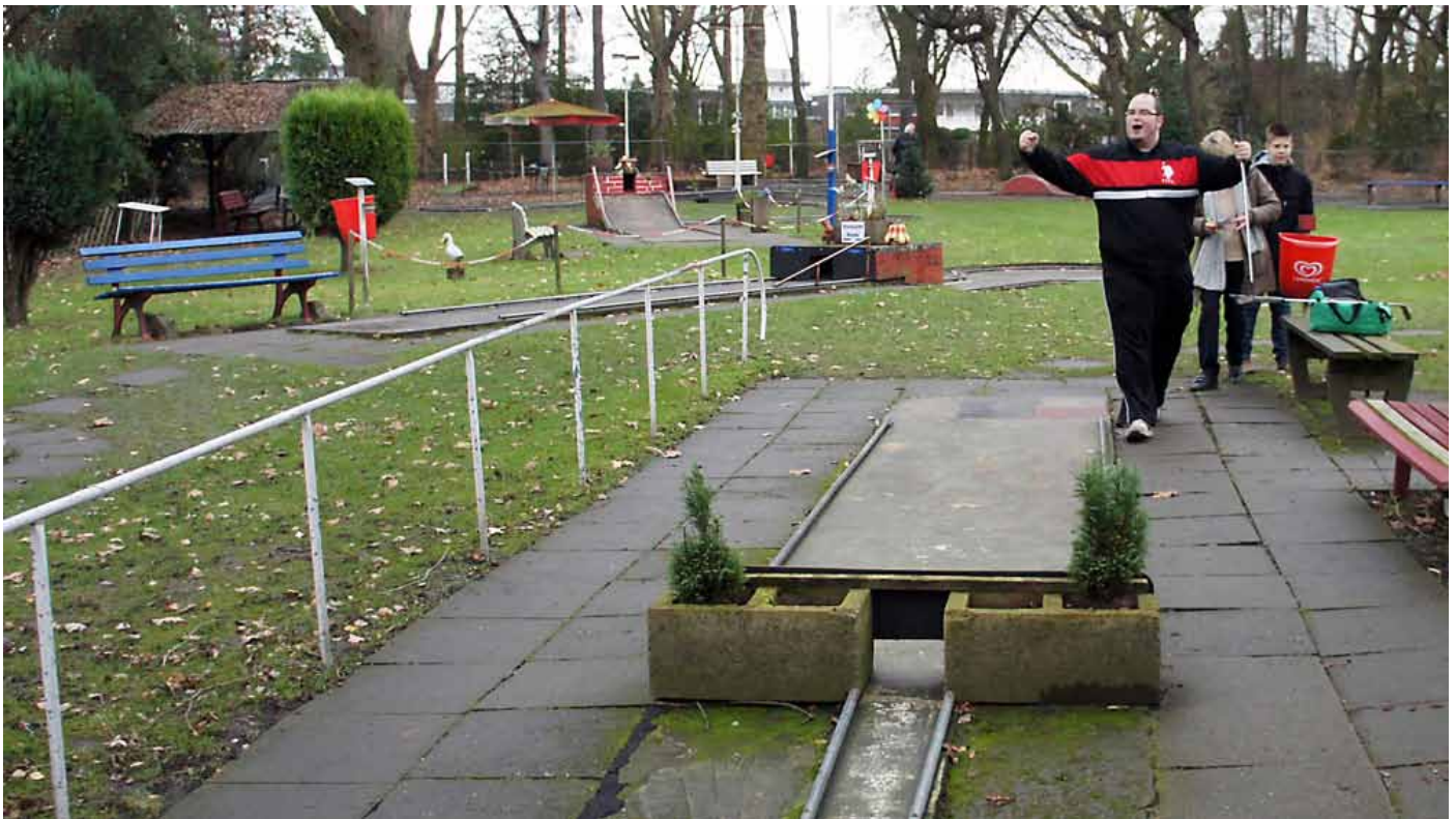
Der letzte Schlag in 2013 auf der Bulmker Anlage im Winterpokal war ein Ass von Carsten Wolf.